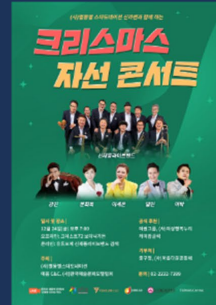
2021 크리스마스 자선콘서트