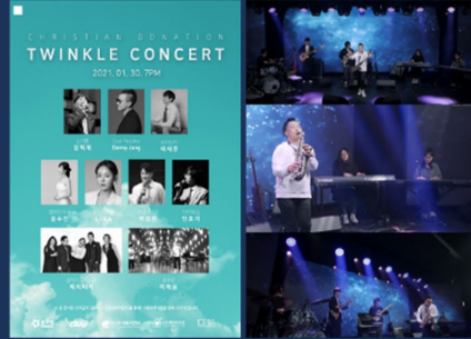
2021 TWINKLE DONATION CONCERT