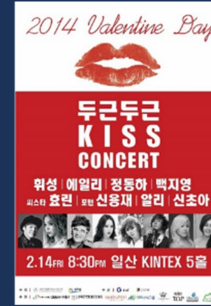
2014 KBS 두근두근 KISS 콘서트