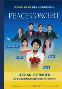
2022 PEACE CONCERT